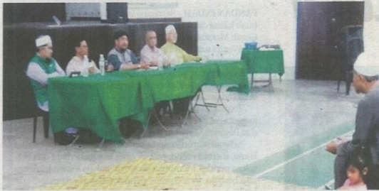
Sebahagian panel yang hadir dalam Program Sembang Politik di Taman Sri Putra.

BANTING - Perjumpaan ahli-ahli Pas dalam Program Sembang Politik yang dianjurkan baru-baru ini dilihat sebagai salah satu usaha persediaan PAS Kawasan Kuala Langat menghadapi PRU14.