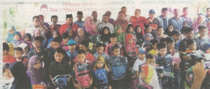
Sebahagian penerima bantuan Program Back To School Jawatankuasa Persatuan Penduduk (JPP) Zon 2 di Kampung Medan, semalam.

"Soal sokongan kita biar rakyat menjadi hakim, apa yang penting gerak kerja kita berterusan, jangan sesekali sekerat jalan," kata-